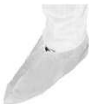
Copriscarpe TNT DPI di Prima Categoria