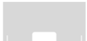
EXTRA - LARG