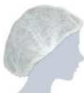
Cuffia TNT DPI di Prima Categoria