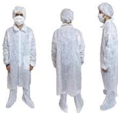
Kit Completo con Mascherina TNT